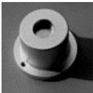
Klucz 806 normal