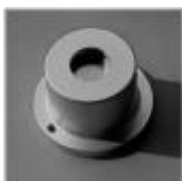
Klucz 806 strong